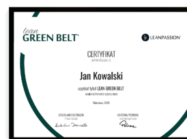
LEAN 3D PRACTITIONER ORAZ LEAN GREEN BELT®