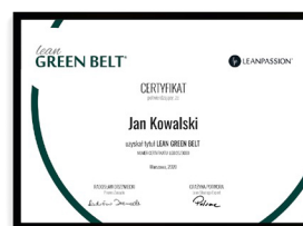
LEAN 3D PRACTITIONER ORAZ LEAN GREEN BELT®